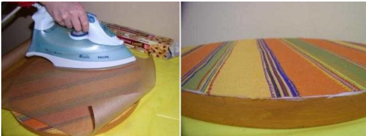
Декупаж для начинающих — может попробовать что-то типа этого?

На высохшую поверхность укладываем и разравниваем салфетку, приглаживаем ее руками. На нее укладываем кусок бумаги для выпекания и горячим утюгом от края начинаем приглаживать.