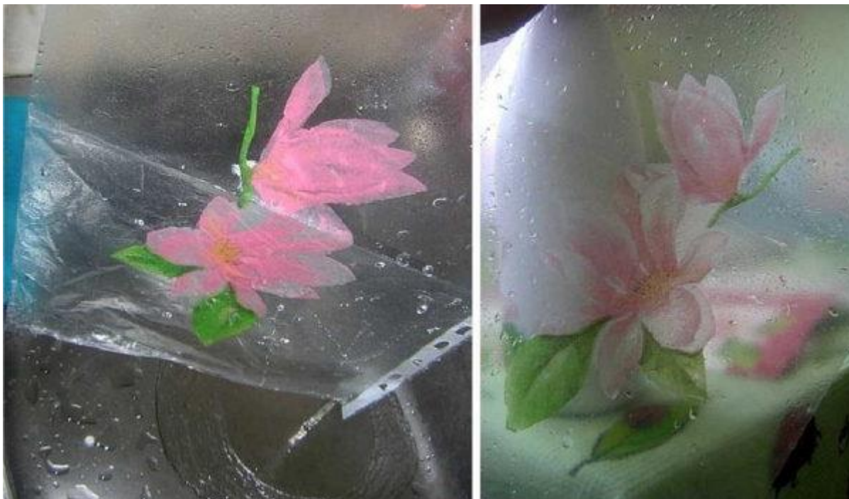
Фрагмент расправляем в воде на файле

файла наливаем немного чистой воды, в нее, лицом вниз, укладываем вырезанный фрагмент. Его тщательно расправляем, выгоняя пузырьки и расправляя складочки. В лужице воды это несложно.