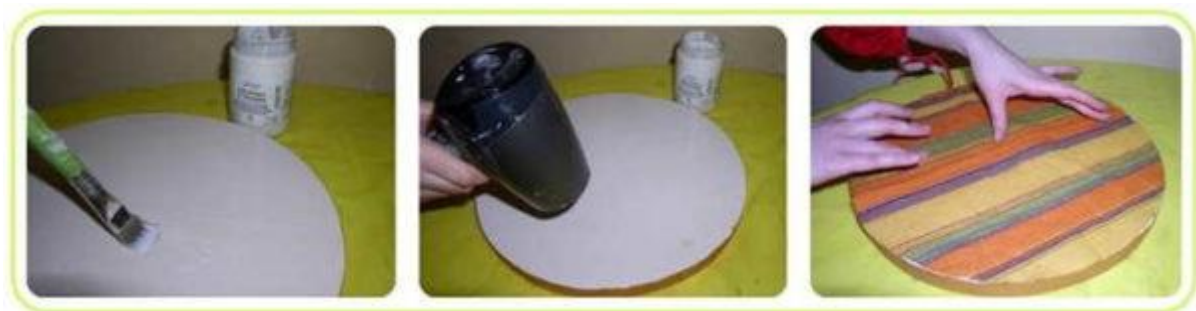
Декупажная техника с утюгом

При декорировании ровной поверхности можно поступить проще, чем через всю салфетку гнать пузырьки. На прогрунтованную поверхность наносим слой клея ПВА или промазываем клеем-карандашом. Размазываем хорошо, чтобы не образовывалось «дорожек». Даем высохнуть. Для ускорения процесса можно взять фен.